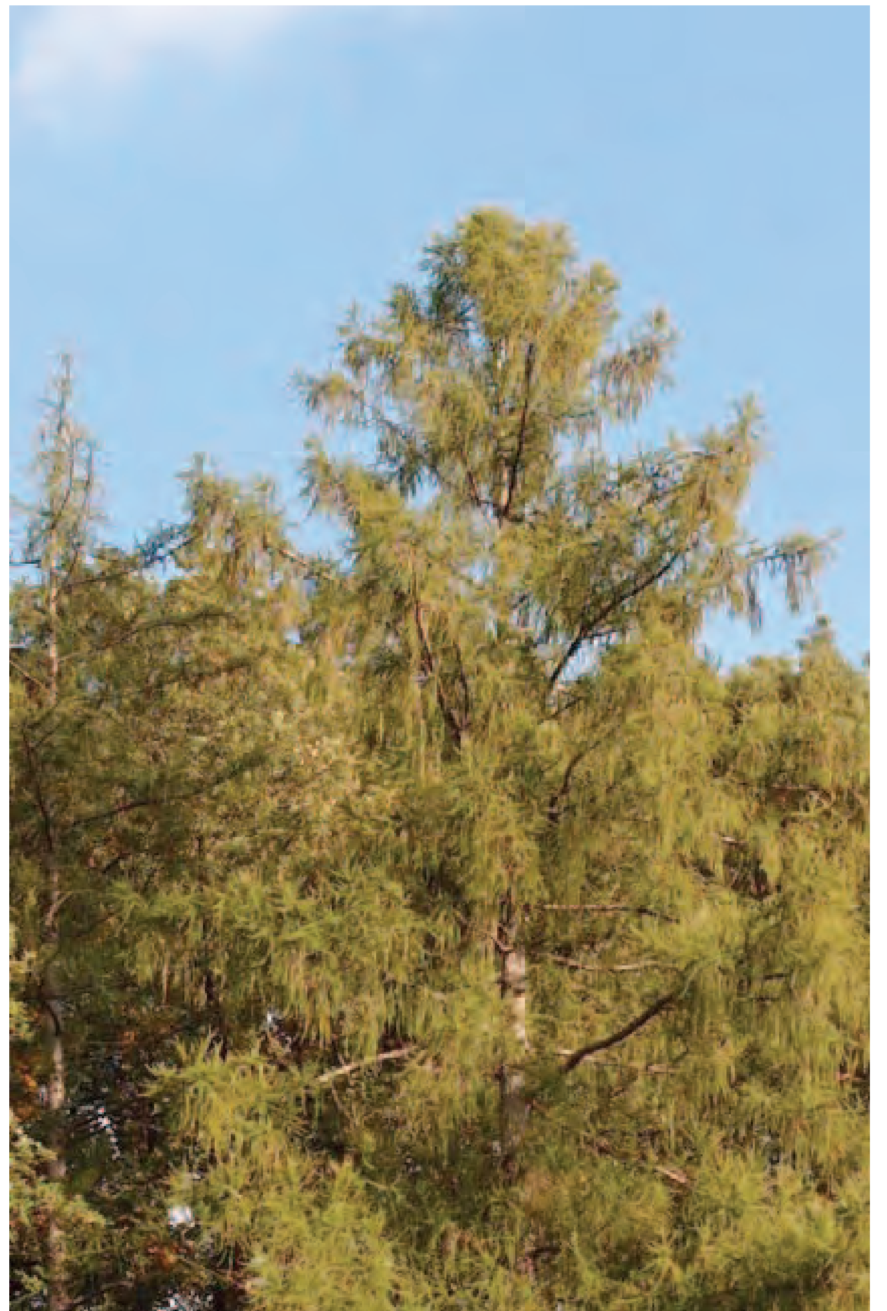
Lärche am Waldrand bei Scheinfeld